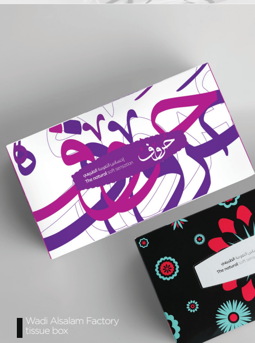
Wadi Alsalam Factory tissue box