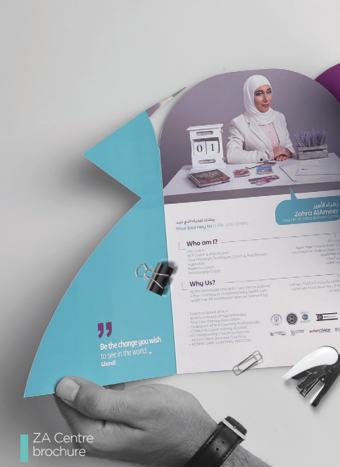
ZA Centre brochure