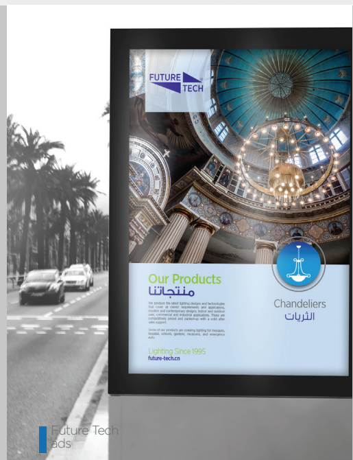
Future Tech ads