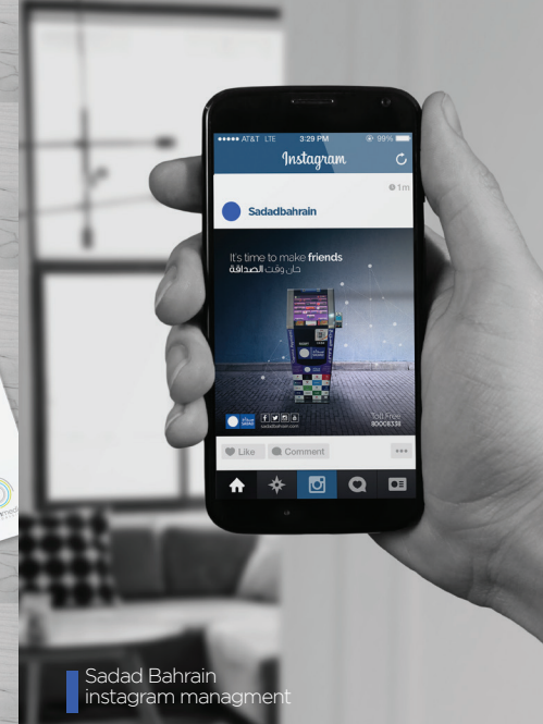
Sadad Bahrain instagram management