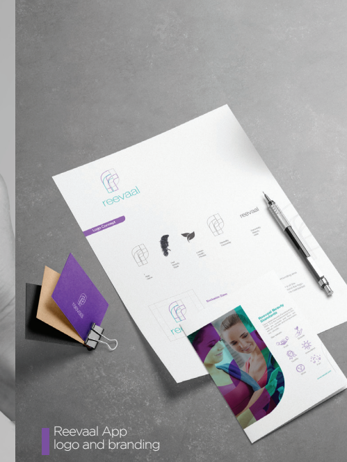
Reevaal App logo and branding