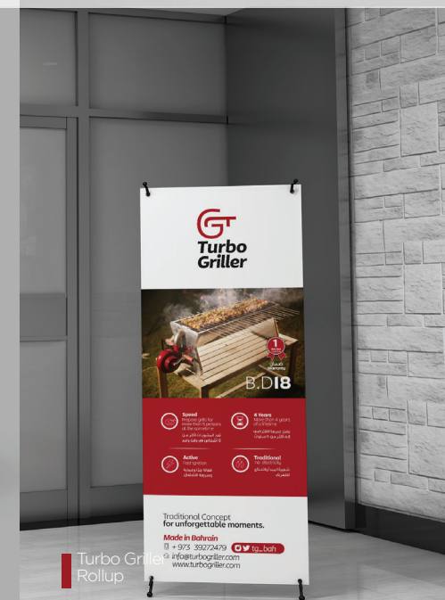
Turbo Griller Rollup