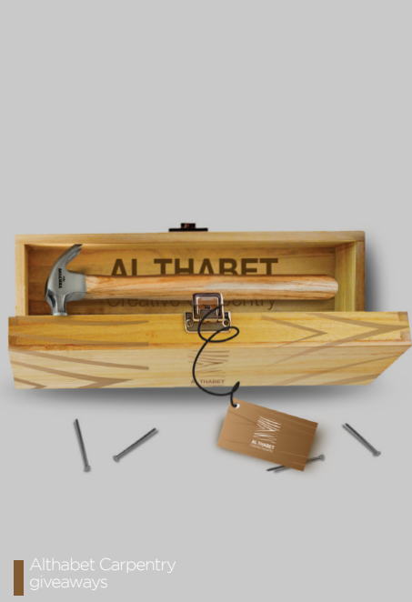
Althabet Carpentry giveaways