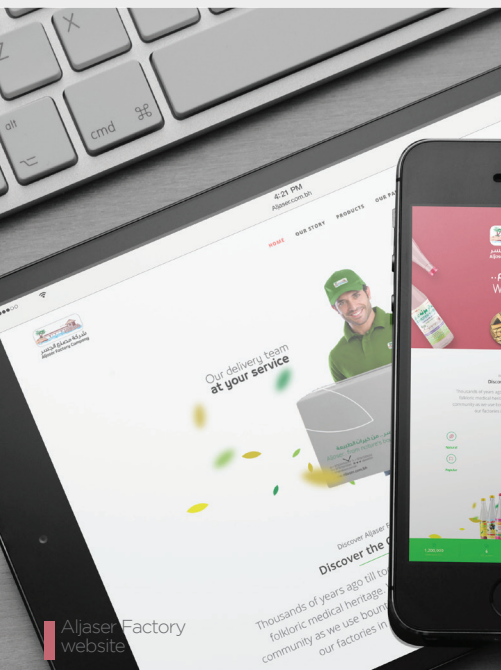
Aljaser Factory website