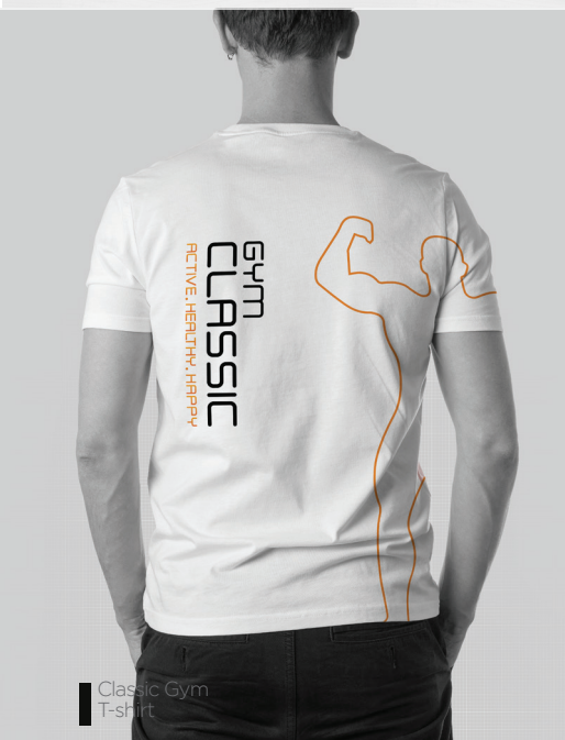
Classic Gym T-shirt