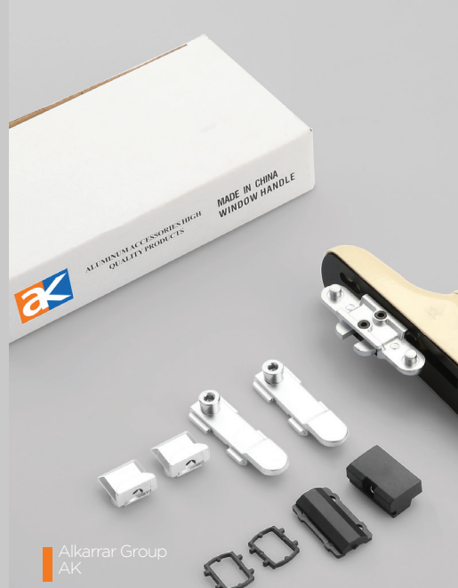
Alkarrar Group AK