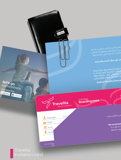
Travellia invitation card