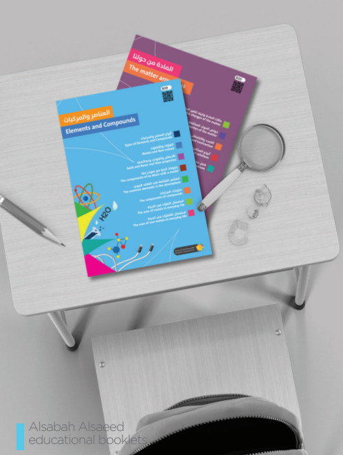
Alsabah Alsaeed educational booklets