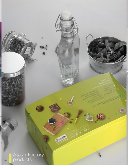
Aljaser Factory products