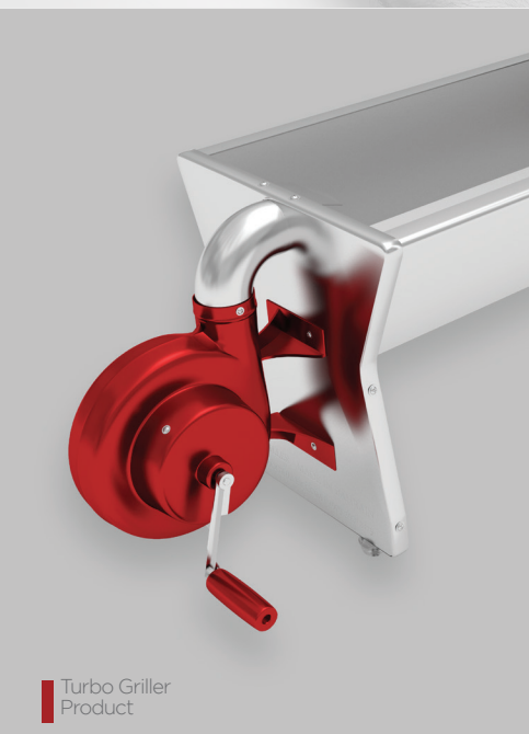
Turbo Griller Product